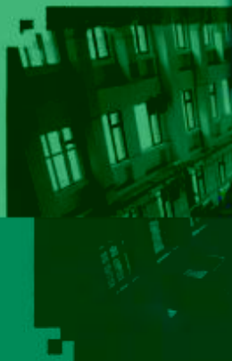
CNC 数控技术 训练场所